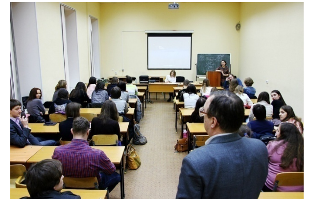
СНО кафедры социологии