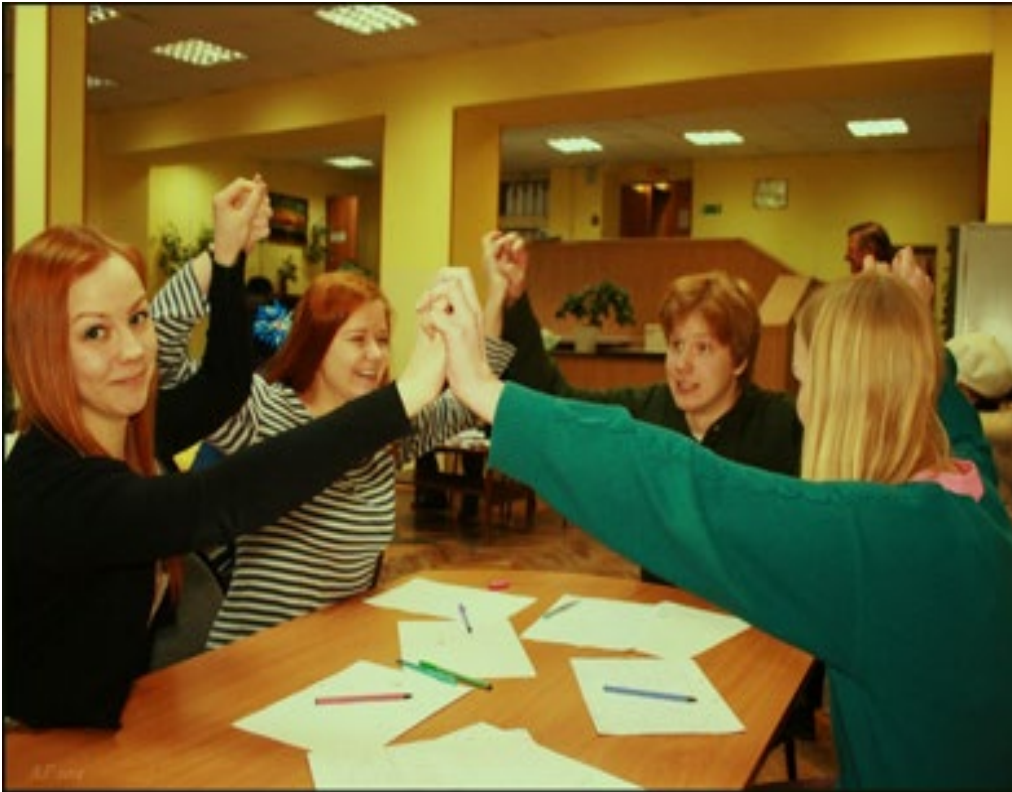
Что? Где? Когда?