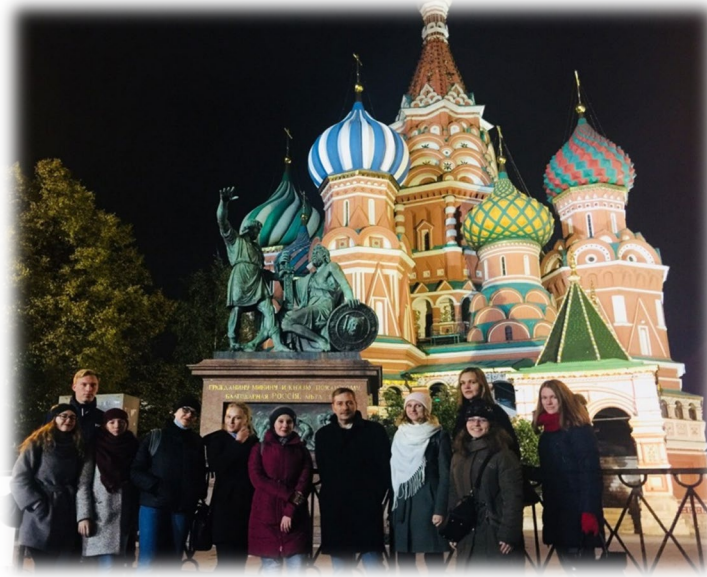
СНО кафедры методики обучения истории и обществознанию