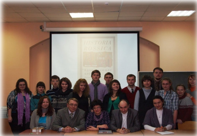
СНО кафедры русской истории