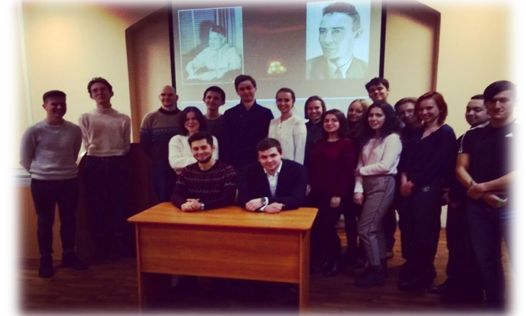
СНО кафедры всеобщей истории